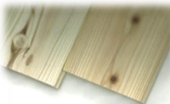
【節有 A 浮造り】