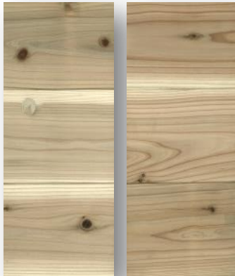
【節有 A】 【無節上小込】